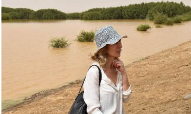
Visite d'un écosystème de mangrove en cours de restauration au PND