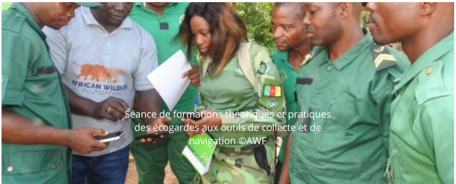
Séance de formations théoriques et pratiques des écosurveillants aux outils de collecte et de navigation

Cette formation a permis d'améliorer les capacités des participants à mettre en œuvre des actions de conservation efficaces et durables au sein du Parc National de Campo-Ma'an.